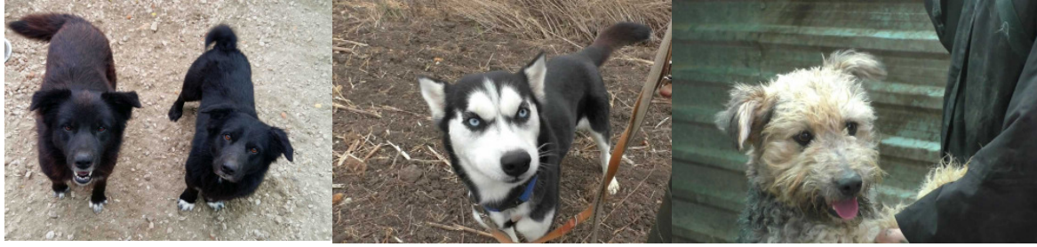
Zorro & Bojti